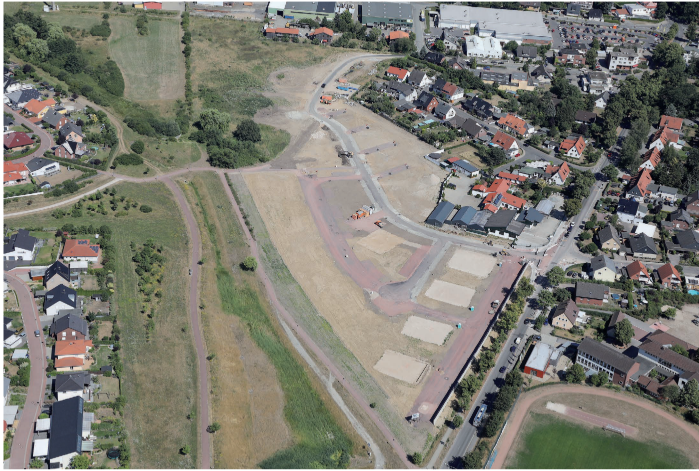
Luftbildaufnahme vom Baugebiet

Die Erschließungsarbeiten für das Baugebiet der Bauunternehmen Schmidt GmbH „An der Gärtnerei“ in Ehmen sind abgeschlossen. Großflächig grün angelegt, wird sich hier den zukünftigen Eigentümern ein weitläufiges, modernes und harmonisches Gesamtensemble aus Eigentumswohnungen, Doppelhäusern und Einfamilienhäusern bieten, die zum einen ein Gemeinschaftsgefühl zwischen den Anwohnern schaffen und zum anderen die Privatsphäre bewahren. Für die heutige Zeit und auch für die Zukunft gerüstet, wird das Baugebiet mit dem Glasfasernetz für schnelle Telekommunikation über die WOBKOM versorgt. Ebenfalls berücksichtigt ist das Thema der E-Mobilität. Zur Schulwegsicherung und zur